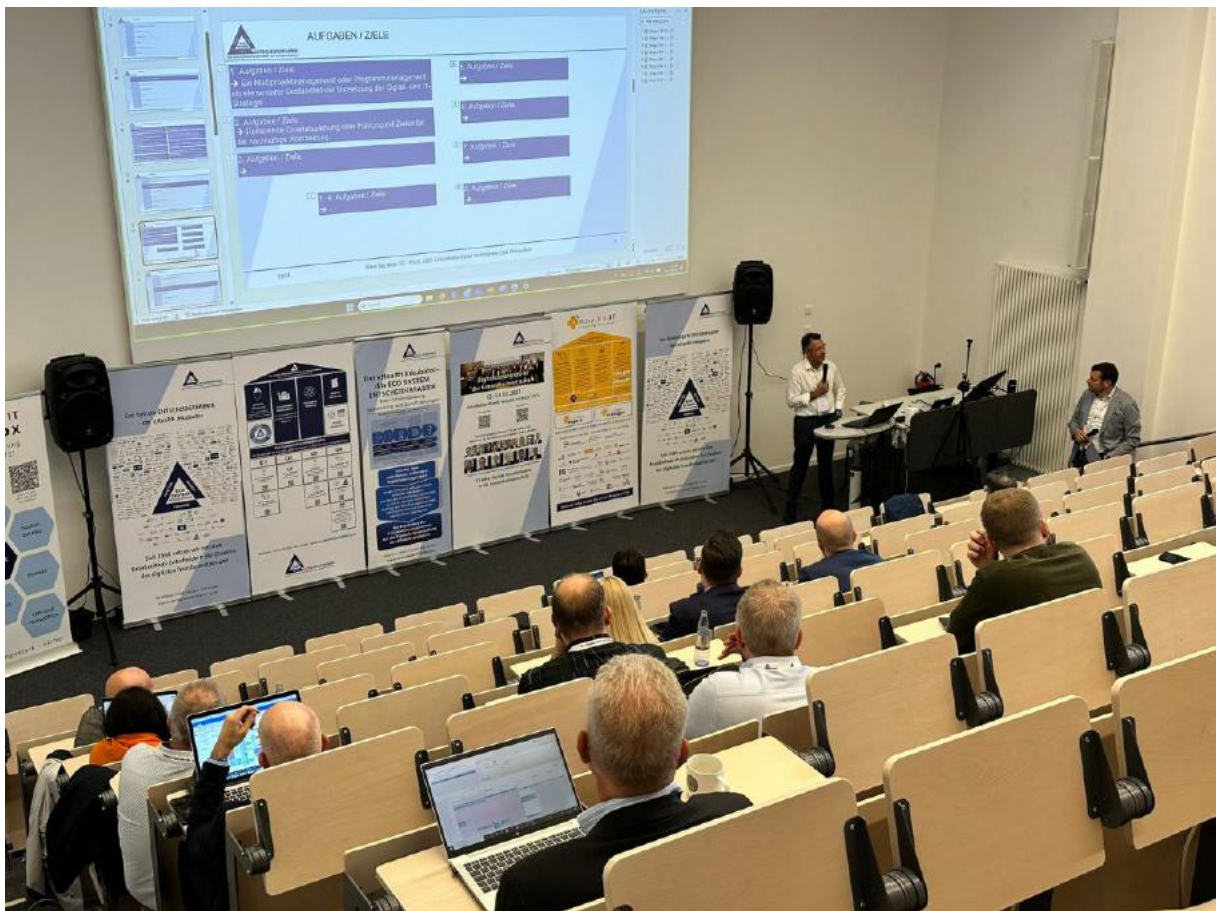
Bild: Auditorium Arbeitsgruppe 1