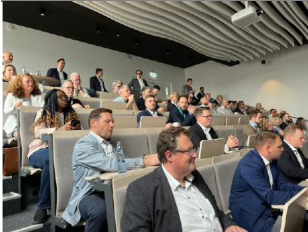
Bild: Auditorium Begrüßung und Initialvortrag