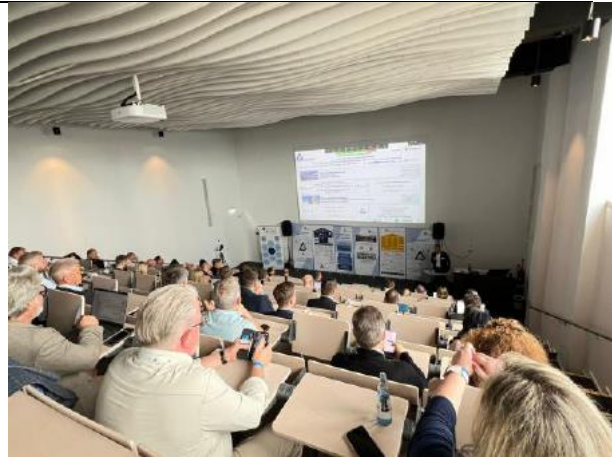
Bild: Auditorium Begrüßung und Initialvortrag