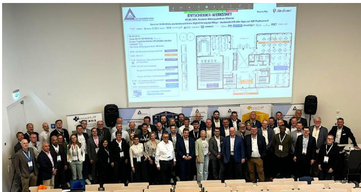
Bild: Gruppenfoto Entscheider-Werkstatt 2024 bei den Alexianern 09.10.2024

„Kurz vor KHZG-Ende, wo stehen wir in der Digitalisierung der Pflege – Ausbau KIS oder Apps auf IOP-Plattformen?“