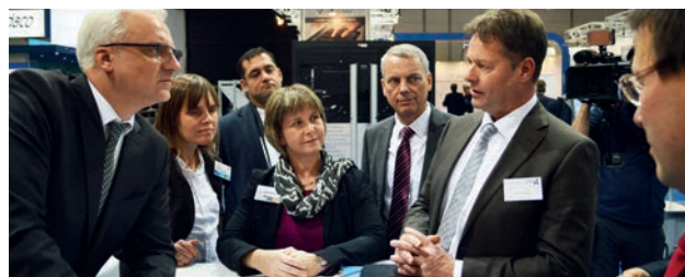
Der nordrhein-westfälische Wirtschaftsminister Garrelt Duin (l.) lässt sich am „Live-View-Stand“ der Entscheiderfabrik von IT-Experten und Verbandsvertretern erklären, wie der jährliche Wettbewerb der IT-Schlüsselthemen funktioniert.

der renommierten Medizin-Messe, prämierte die Entscheiderfabrik auch Unternehmen und Klinikmanager für besonders herausragende Leistungen. Die Wahl traf dabei der Rat der Initiative für Unternehmensführung und IT-Service-Management in der Gesundheitswirtschaft, kurz „IuiG-Initiativ-Rat“, der aus den fördernden Verbänden der Entscheiderfabrik besteht.