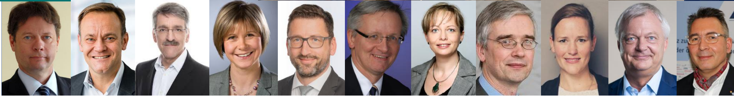
Vorsitzende, Feedbackgeber, Wahlteamleitung, Moderatoren und Sommer-Camp Gastgeber