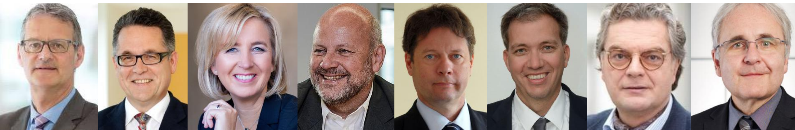
Die Diskutanten des Gala Dinner: Gesundheitswirtschaft 2023 – sind wir richtig aufgestellt – was fehlt ?